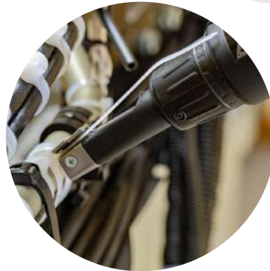
Tête fine et rotative