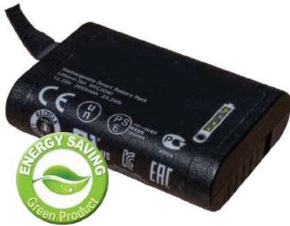
Outil sur batterie